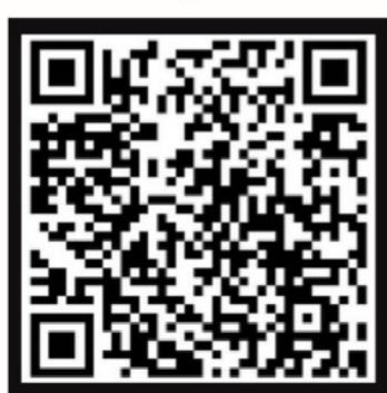
สแกน QR Code